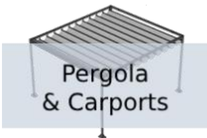
Pergola & Carports